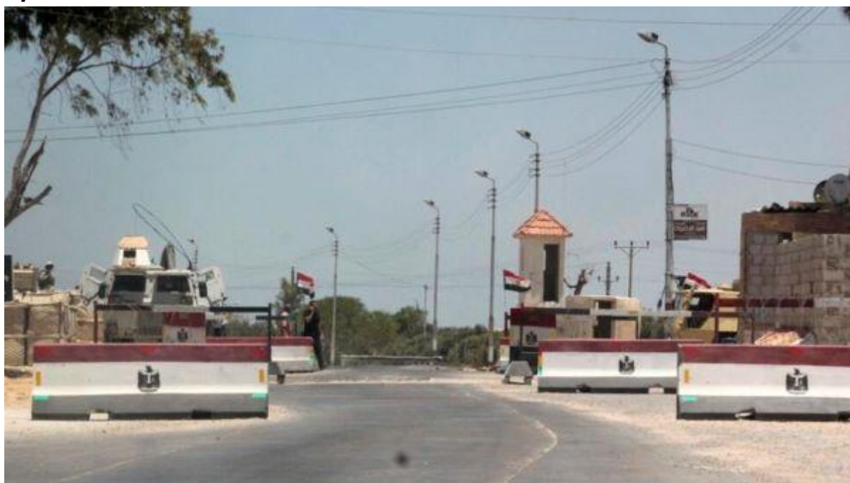
Ảnh minh họa : Chốt kiểm soát của quân đội Ai Cập tại El-Arich, Bắc Sinai.

Ai Cập “sẽ không dùng một phần lãnh thổ của mình để tiếp nhận những di dân Palestine” đến từ dải Gaza. Nguyên soái Abdel Fattah al-Sissi, nguyên thủ quốc gia Ai Cập từ năm 2013, trong một cuộc họp báo gần đây, đã bác bỏ giả thuyết trên kể từ khi xung đột Israel-Hamas nổ ra hôm 07/10/2023. Ông al-Sissi phát biểu : “Chiến dịch này nhằm thúc đẩy người Palestine sơ tán sang Ai Cập và đó là điều không thể chấp nhận.”