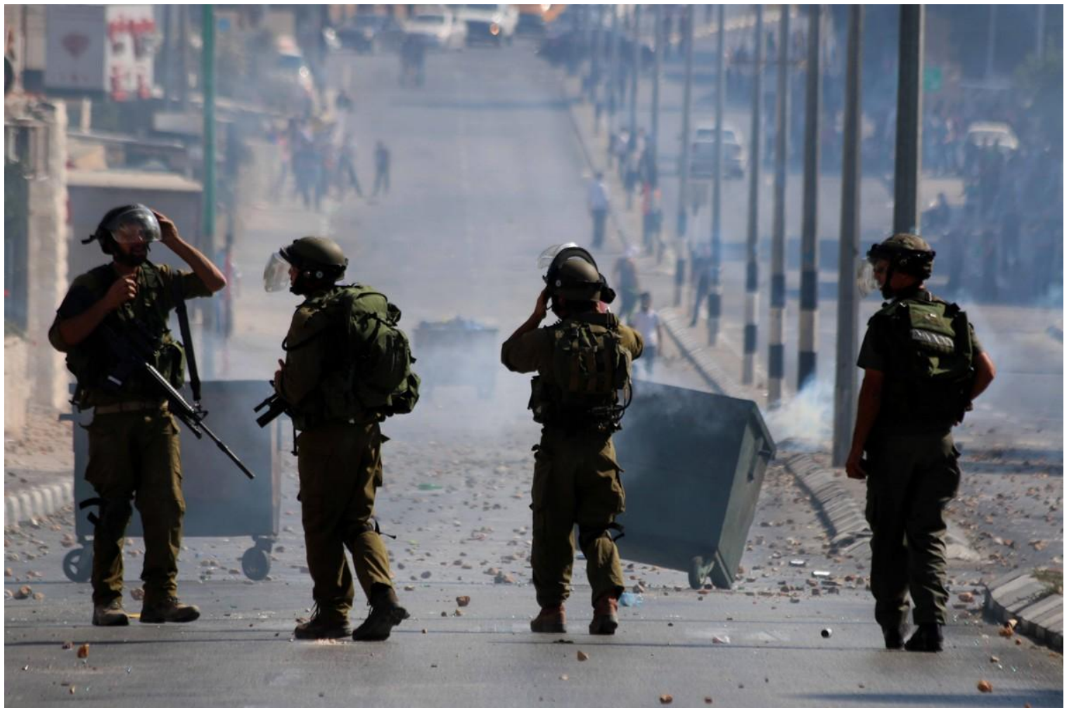
Những người lính Israel ở Bethlehem vào năm 2014. Ảnh: Anna Ferensowicz/Pacific Press

Cho đến ngày nay, xung đột ở Trung Đông giữa người Israel và người Palestine vẫn chưa được giải quyết và chiến tranh vẫn tiếp tục nổ ra trong khu vực. Hầu như không có vùng đất nào trên thế giới lại có tình hình chính trị hỗn loạn, điều kiện địa lý bị chia cắt và ý kiến về những điều này lại bị phân cực như ở đây. Ngay cả khi các cuộc tấn công gần đây của Hamas nhằm vào Israel là chưa từng có thì cuộc xung đột chỉ có thể được làm sáng tỏ bằng cách nhìn vào lịch sử. Nhờ đó mà có thể hiểu rõ hơn những vấn đề gây tranh cãi vẫn tiếp tục thống trị cho tới ngày nay.