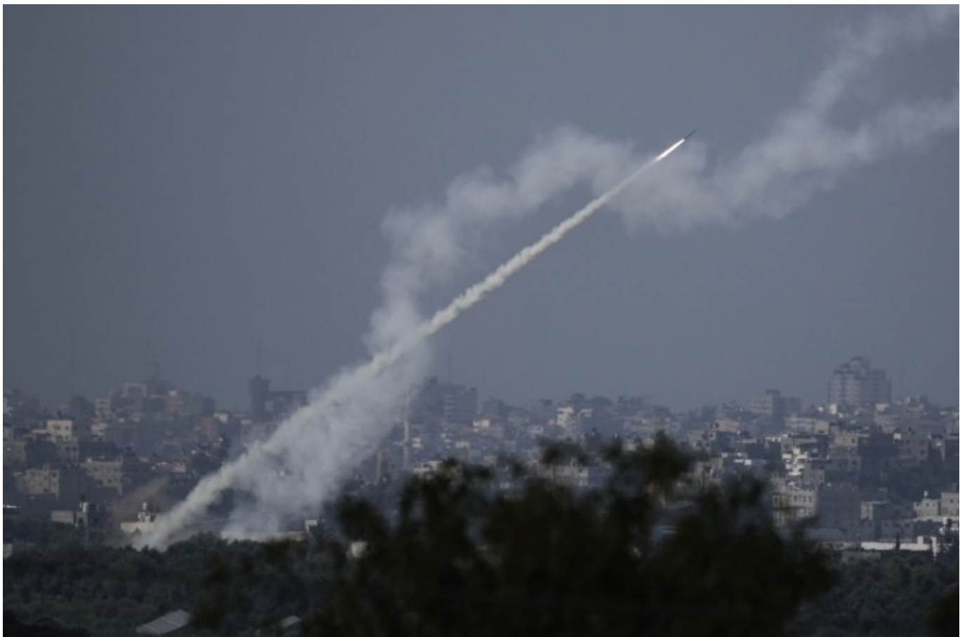
Một hỏa tiễn được phóng từ Dải Gaza sang Israel.

Hamas đã sản xuất tên lửa cho riêng mình trong nhiều năm, chẳng hạn như loại Qassam tương đối đơn giản. Phiên bản mới nhất của tên lửa đất đối đất không điều khiển được cho là có tầm bắn lên tới 20 km. Höfner cho biết, tên lửa có tầm bắn từ 15 đến tối đa 30 km chiếm phần lớn trong kho vũ khí của Hamas. Về mặt kỹ thuật, những thứ này chỉ có thể lái được giống như “pháo hoa cải tiến”, nhưng sức nổ của chúng vẫn có thể gây ra thiệt hại đáng kể.