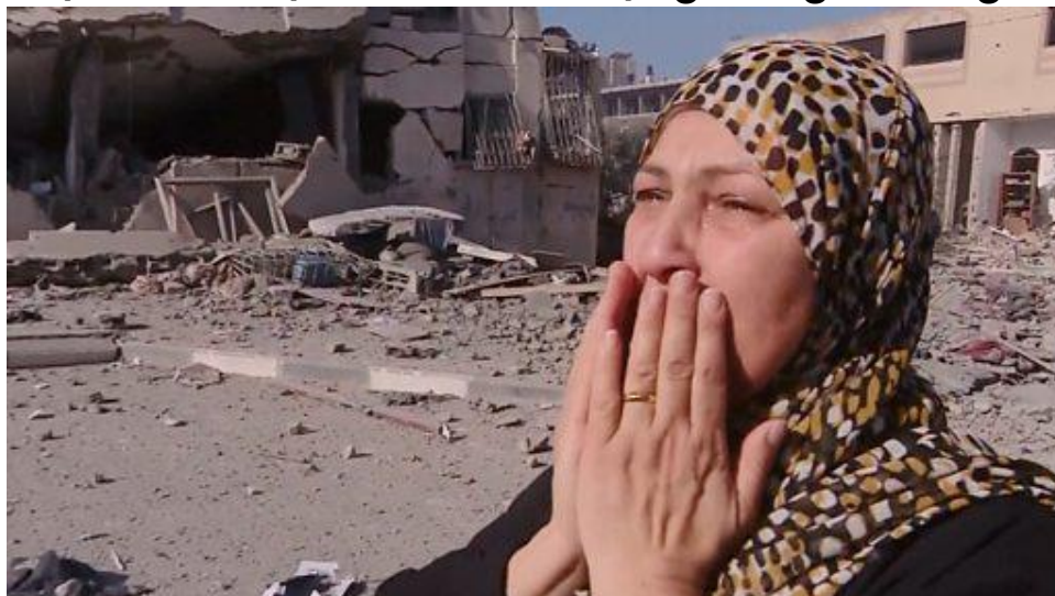
Chiến tranh Israel-Gaza: Toàn bộ khu dân cư biến thành đống đổ nát 🗑️

Những viện trợ quân sự gần đây của Mỹ trong khu vực đã thể hiện sự tổn kém - về mặt chính trị, kinh tế và mạng sống của người Mỹ.