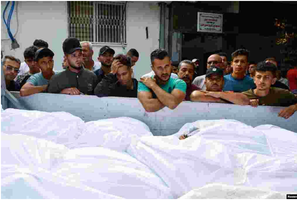
2. Những người đến dự đám tang của những người Palestine thuộc gia đình Shamalkh, những người mà giới chức y tế cho biết đã thiệt mạng trong các cuộc không kích của Israel, tại Thành phố Gaza, ngày 9 tháng 10 năm 2023.